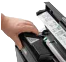
Substitua o frasco de toner de longa duração com facilidade e rapidez