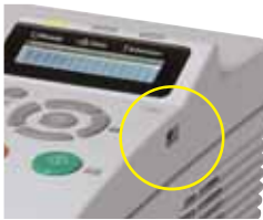
FS-1370DN: Imprima suas arquivos diretamente a partir da memória utilizando a conveniente Interface USB Host