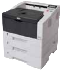
FS-1320D (acima) e FS-1370DN mostrados com dois alimentadores de papel adicionais.